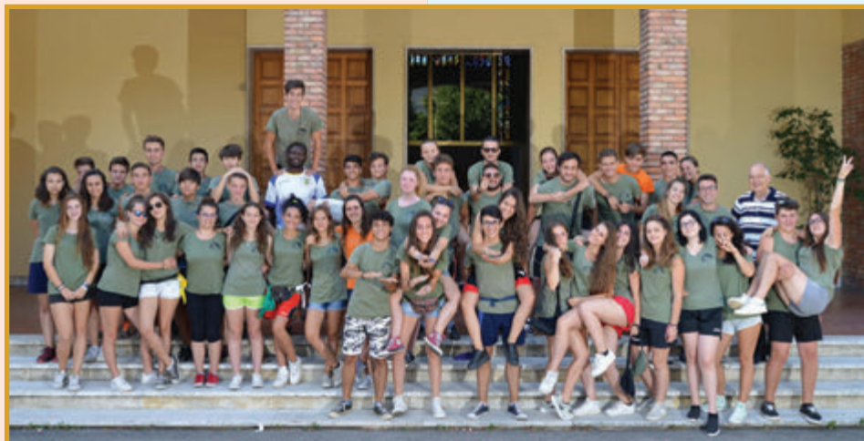
13.07.2016 - Alcuni Animatori del Grest

Dall'anno scolastico 2015/2016 tutti gli studenti del triennio delle Scuole Superiori devono compiere un'esperienza lavorativa durante il periodo estivo o durante l'anno scolastico. Alcuni di noi, studenti del Liceo Lorenzini di Pescia , abbiamo scelto di effettuare questa esperienza lavorativa presso l'Oratorio Murialdo di Montecatini Terme, rivestendo per un mese il ruolo di animatori. Insieme a noi c'era anche una studente del I.T.S. Marchi-Forti di Monsummano.