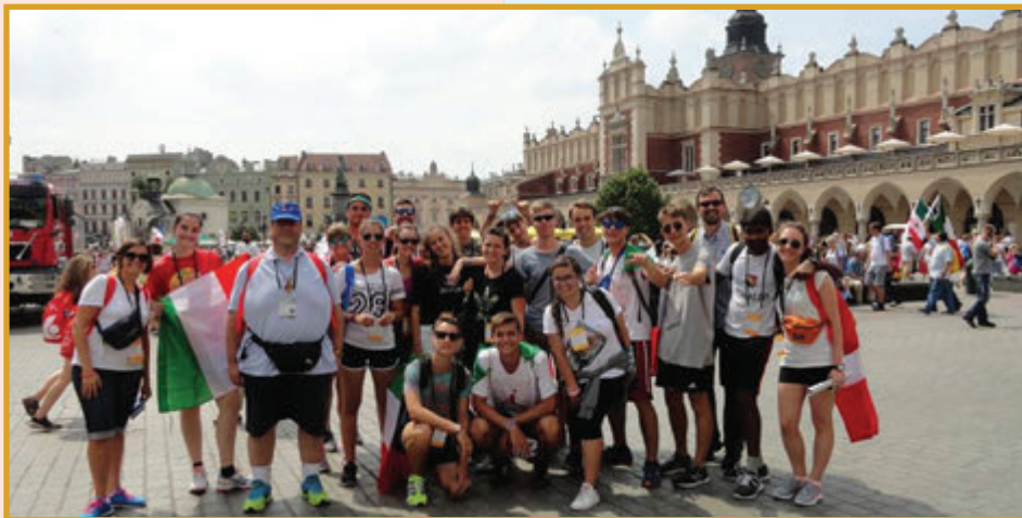
Cracovia, 27 Luglio 2016 - Alcuni partecipanti alla GMG 2016

In Polonia, a Cracovia , si sono svolte dallo scorso 26 al 31 luglio le Giornate Mondiali della Gioventù (GMG). Ad esse ho partecipato anch'io con il gruppo di 320 giovani dei Giuseppini del Murialdo. Premetto che questa è stata la mia prima GMG e proprio per questo non mi ero prefissata un obiettivo preciso se non quello di viverla a pieno in tutte le sue sfaccettature.