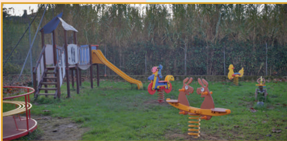
Spazio-bimbi del nostro Oratorio che, nell'occasione del Grest, il Lions Club Massa Cozzile Valdinievole ha migliorato con il dono di alcuni nuovi giochi.