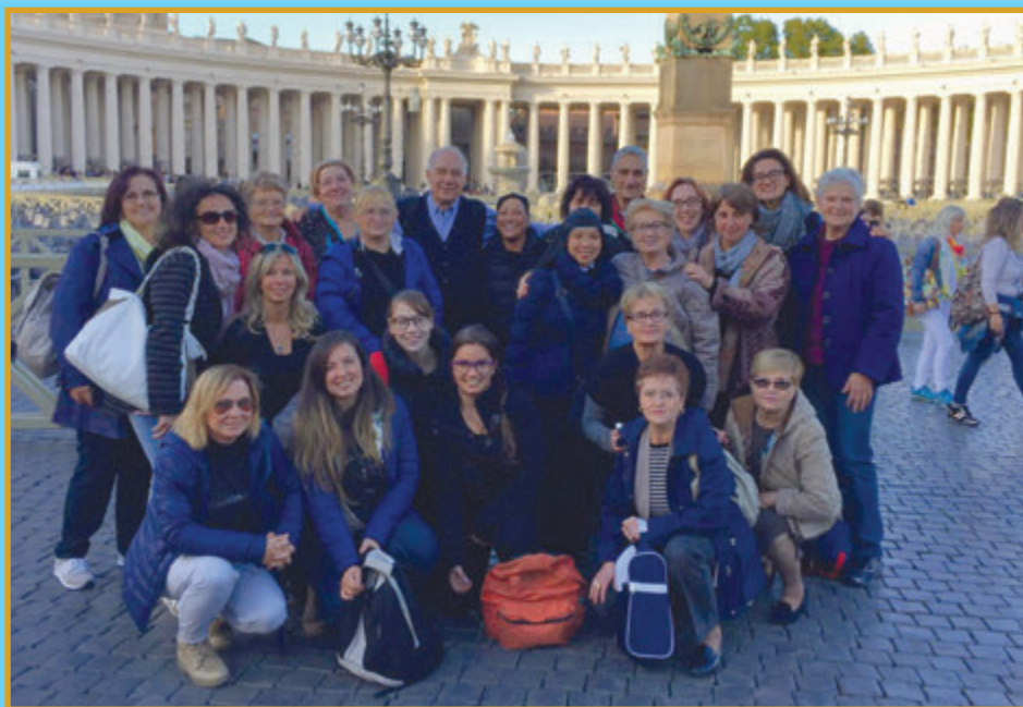
12 ottobre 2016 – Alcuni dei circa 600 partecipanti al Pellegrinaggio diocesano a Roma per il Giubileo straordinario della Misericordia