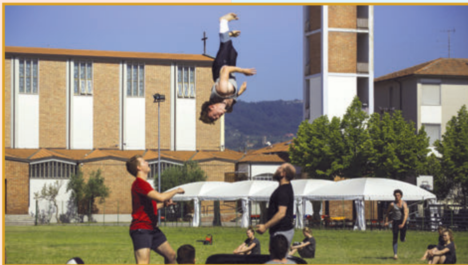
1.07.2016 - Ginnasti danesi in visita al Grest