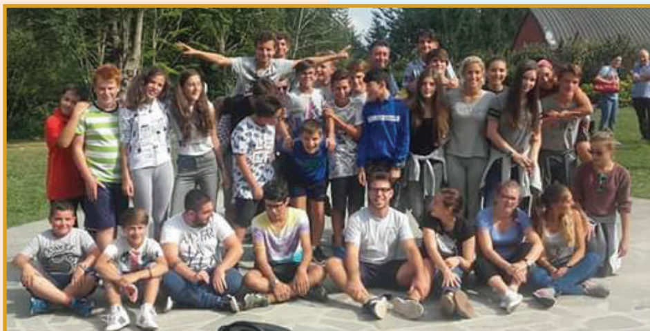
29 agosto – 4 settembre – Campo-Scuola al Parco Nazionale dell'Orecchiella. Ad esso hanno partecipato 36 ragazzi/e con i loro animatori.